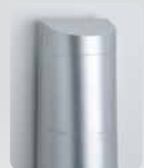
AS silber VdS-Kl. C G 106056 Art.-Nr. 400059540

OAS = Optisch-/Akustischer Signalgeber AS = Akustischer Signalgeber