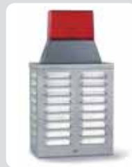
Akustisch-/Optische Kompakt-Signalgebereinheit ES 12 K/FBL 12

Zur optischen Alarmierung dient eine Blitzröhre. Der eingebaute Druckkammerlautsprecher mit Tongenerator sorgt in Verbindung mit der Blitzröhre für eine optimale Signalwirkung bei geringem Stromverbrauch und hoher Witterungsbeständigkeit.