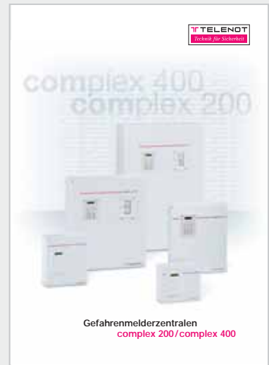
Prospekt „complex 200/400“

Für weitere Informationen, fordern Sie bitte die oben abgebildeten Broschüren an.