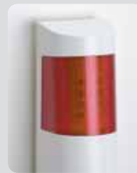
OAS-R weiß mit roter Linse VdS-Kl. C G 106055 Art.-Nr. 100059530

Zur optischen Alarmierung dient eine Blitzlampe, bestehend aus einem Array von 24 LED mit hoher Leuchtkraft, die von einer Blitzschaltung angesteuert werden. Die akustische Alarmierung wird mittels eines elektromagnetischen Starkton-Hornlautsprechers mit Tongenerator realisiert. Der Signalgeber besitzt ein stabiles, schlag- und wetterfestes, zweiteiliges Kunststoffgehäuse. Im Gehäuseoberteil befinden sich die Blitzlampe und der Lautsprecher. Im Gehäuseunterteil befindet sich die gesamte Elektronik mit Tongenerator und Blitzschaltung auf einer gemeinsamen Platine, auf der auch die Anschlussklemmen und die Abschlusswiderstände zur Leitungsüberwachung angebracht sind.