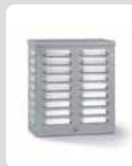
Akustische Kompakt-Signalgebereinheit ES 12 K

100059809 RAL 9016 verkehrsweiß, Zinkor-Stahlblech 100059830 RAL 9016 verkehrsweiß, Alu-Blech 100059835 Edelstahl Optik, Edelstahl V2A