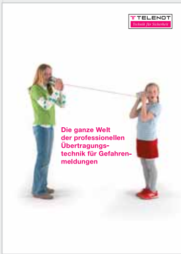
Prospekt „Übertragungstechnik für Gefahrenmeldungen“