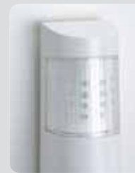
OAS-K weiß mit klarer Linse VdS-Kl. C G 106055 Art.-Nr. 100059531