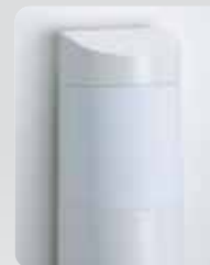
AS weiß VdS-Kl. C G 106056 Art.-Nr. 100059540