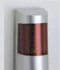
OAS-R silber mit roter Linse VdS-Kl. C G 106055 Art.-Nr. 400059530