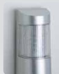
OAS-K silber mit klarer Linse VdS-Kl. C G 106055 Art.-Nr. 400059531