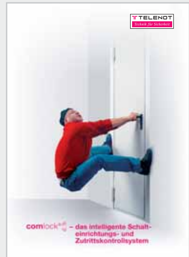
Prospekt „Zutrittskontrollsystem comlock“